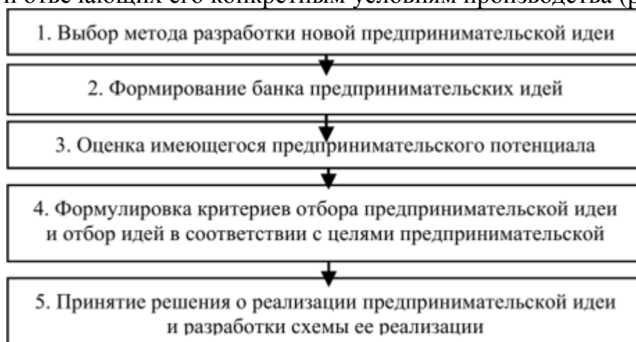
Рисунок 1 - Оценка предпринимательских идей

Предприниматель из накопленных идей осуществляет отбор наиболее перспективных и отвечающих его конкретным условиям производства (рис.1).